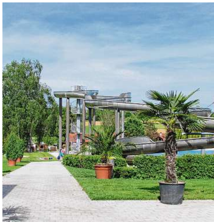
Der Betrieb des Erlebnisbads Engen bleibt vorläufig auf die Sommersaison beschränkt.