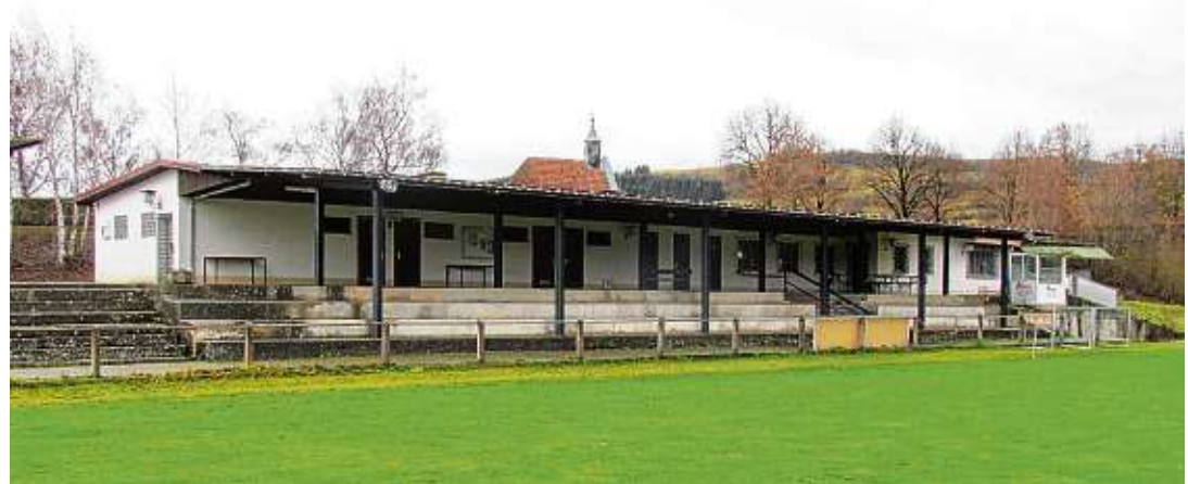
Sie haben bald ausgedient - die derzeitigen Gebäude des Hegauer FV in Welschingen. Das Sportgelände wird ein komplett neues Erscheinungsbild bekommen.

Die nahezu komplett anwesende Vorstandschaft des Hegauer FV bedankte sich für den Beschluss spontan mit Applaus.