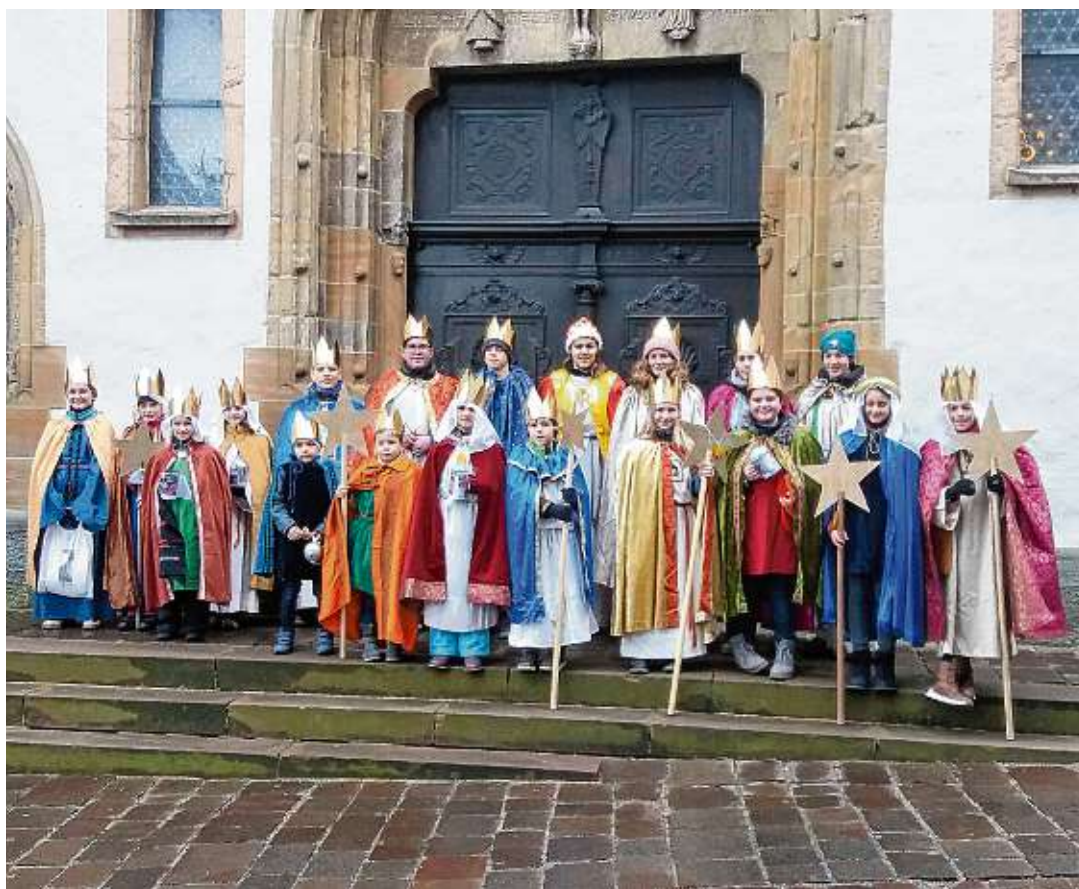
Mit großem Eifer waren die Sternsinger-Gruppen auch in diesem Jahr unterwegs und zogen von Haus zu Haus. Insgesamt wurden in Engen mit Ortsteilen sowie in Aach und in Ehingen 22.633,84 Euro gesammelt.